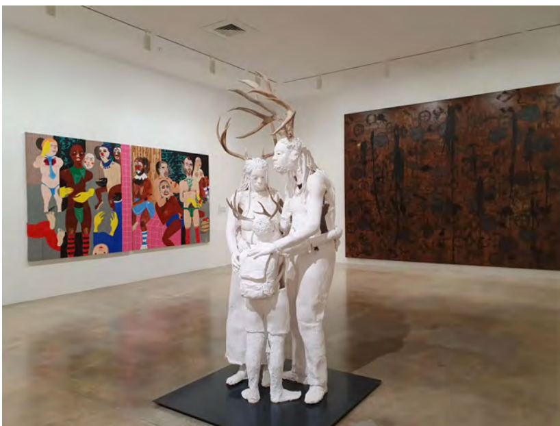
( https://artslife.com/wp-content/uploads/2021/12/rubell-museum-3.jpg )