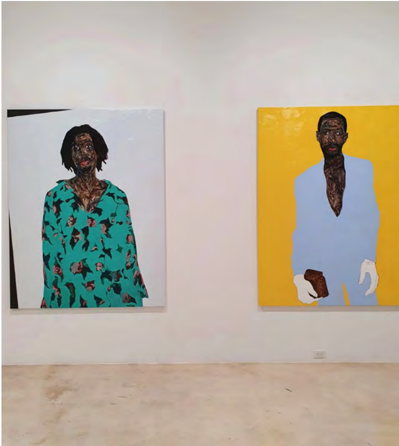
( https://artslife.com/wp-content/uploads/2021/12/rubell-museum-13.jpg )