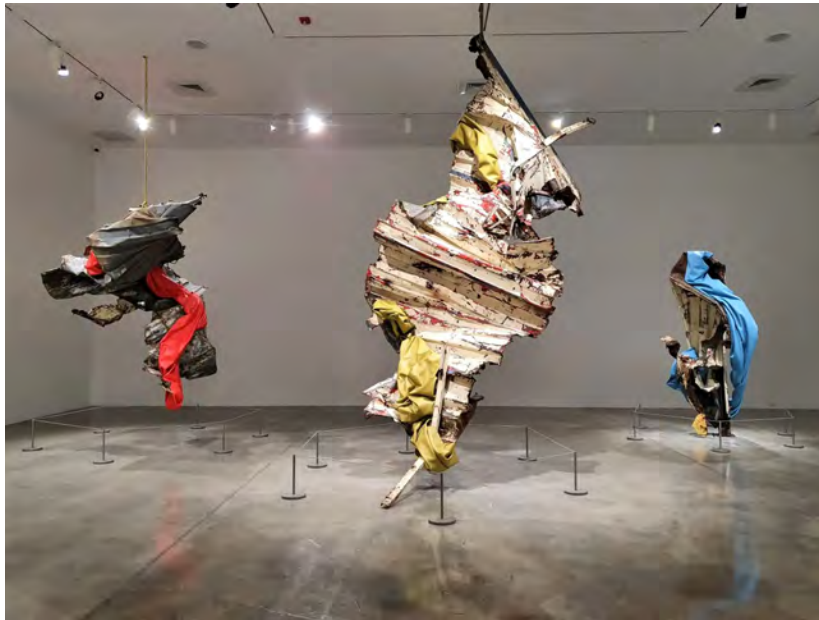
( https://artslife.com/wp-content/uploads/2021/12/rubell-museum-6.jpg )