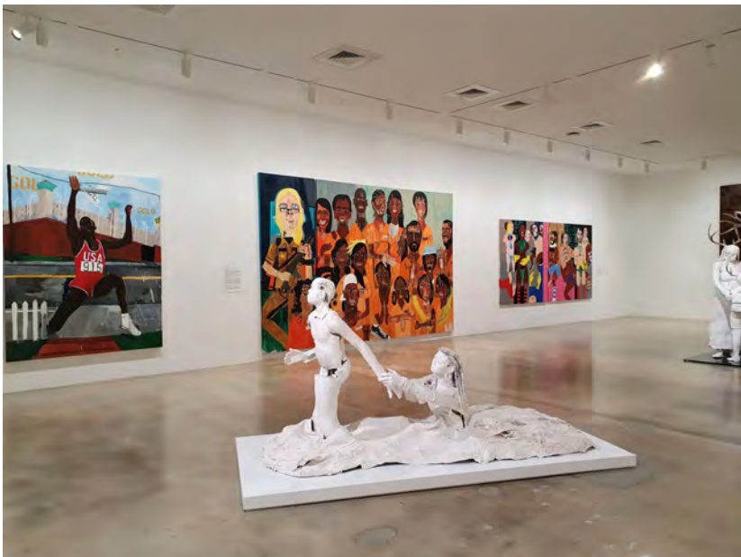
( https://artslife.com/wp-content/uploads/2021/12/rubell-museum-2.jpg )